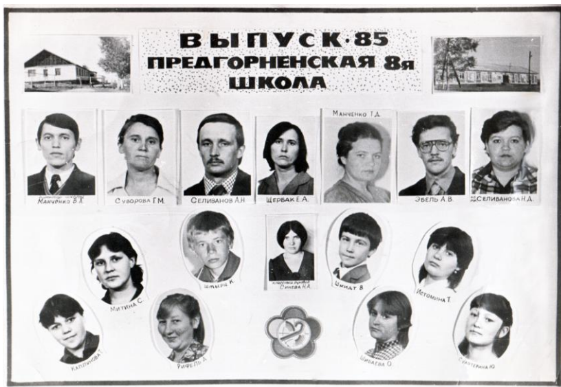
Во время работы учителем в Предгорнинской школе. 1985 г.