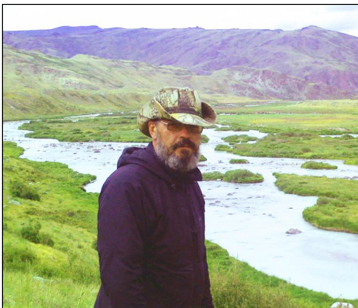
В археологической экспедиции. Долина р. Тархата, Кош-Агачский район. 2010 г.