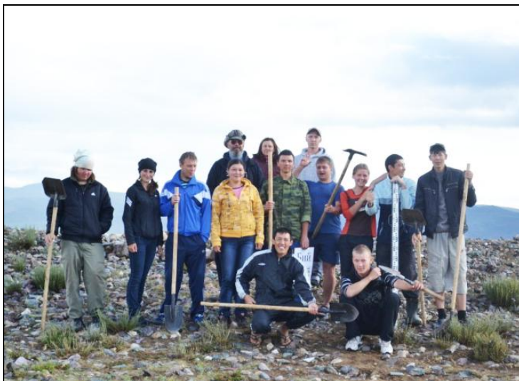
На археологической практике со студентами исторического факультета в Кош-Агачском районе. 2011 г.