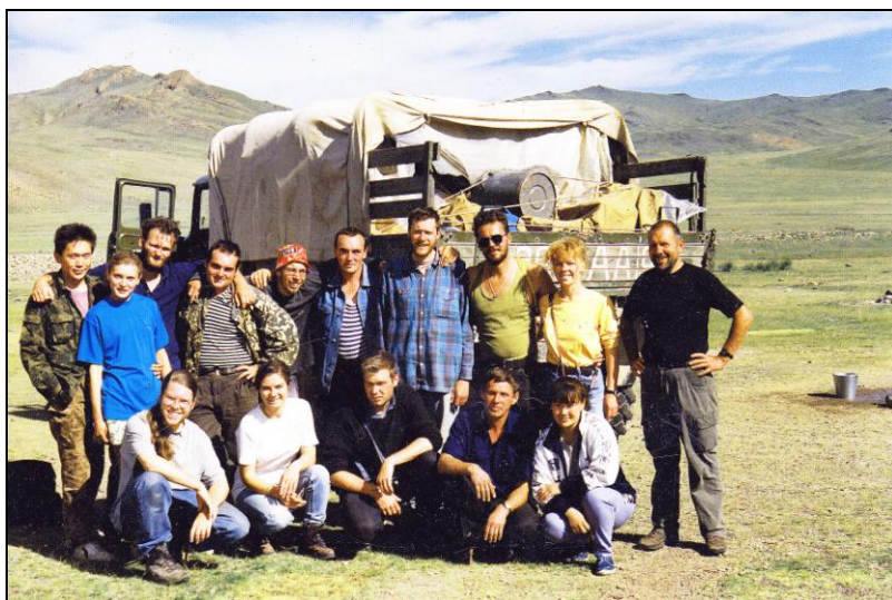
Российско-бельгийская археологическая экспедиция. Долина р. Себистей, Кош-Агачский район. 1997 г.